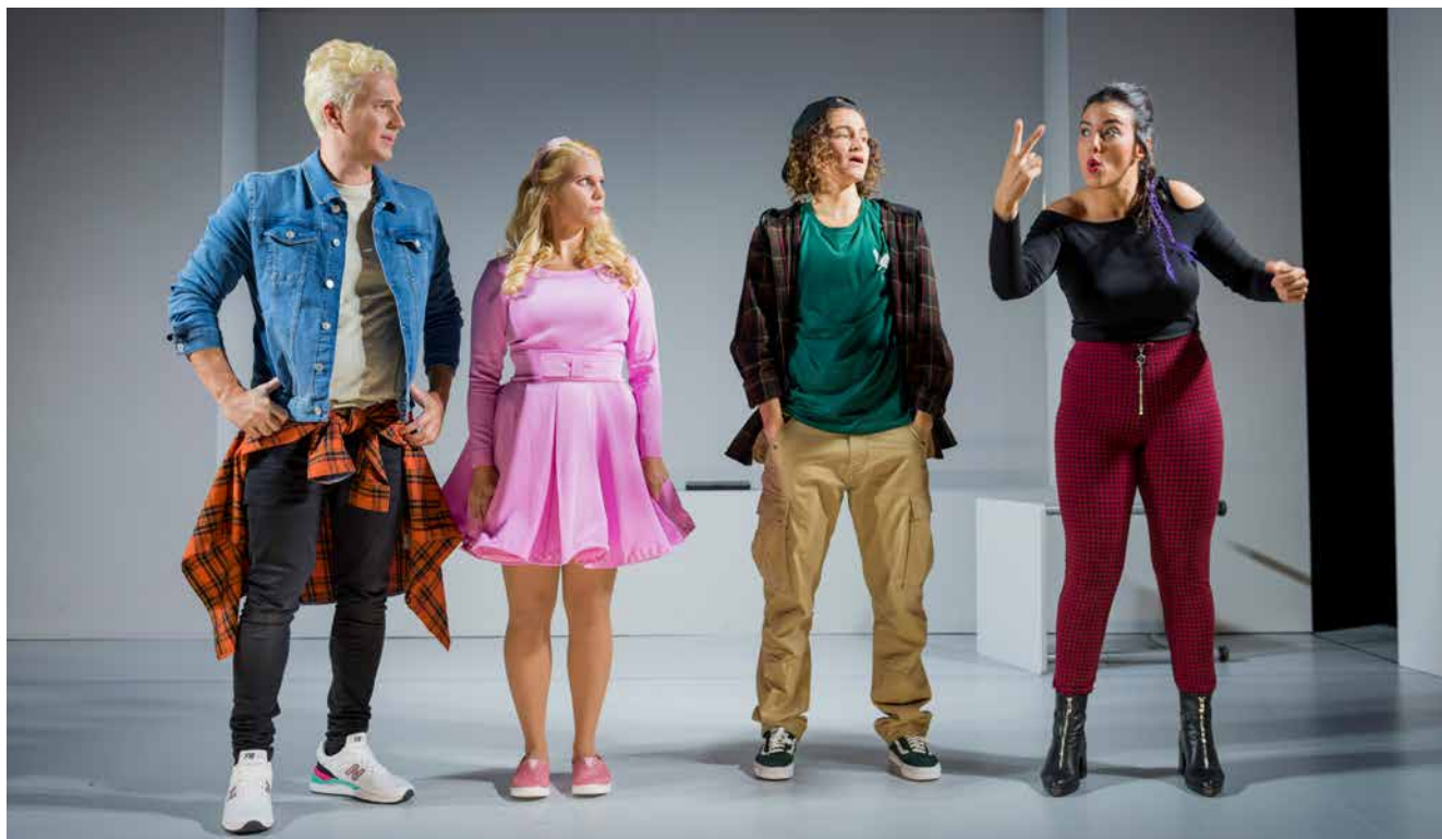
Tyst teater ger föreställningen "Superhjältar" på teckenspråk.